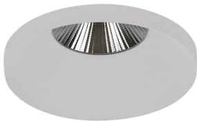
Ø Installation 80 mm